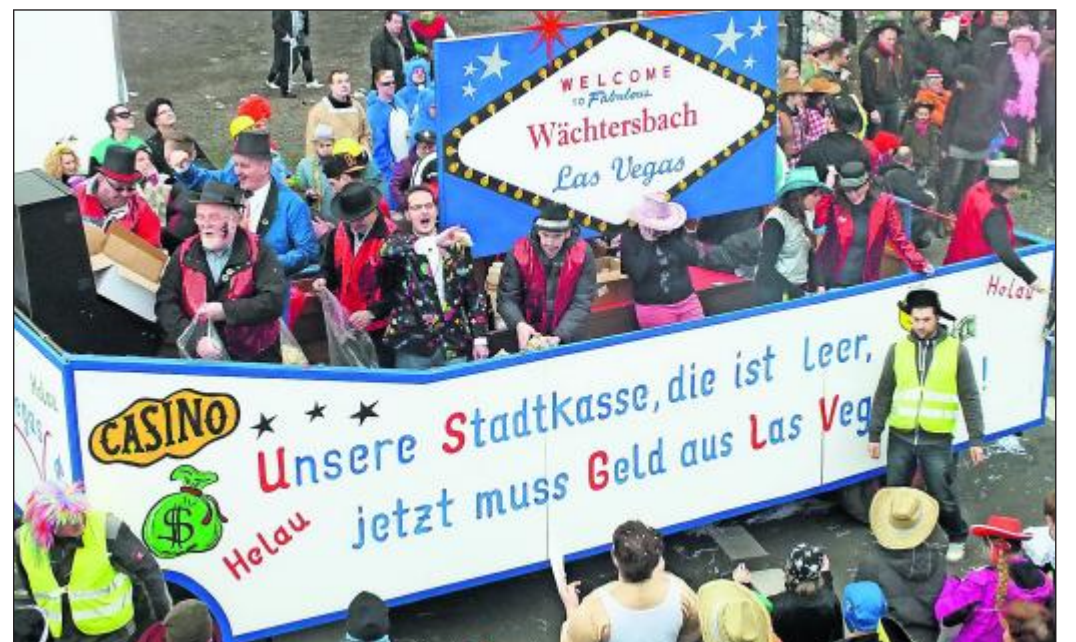
Thema des Magistrats: Die leere Stadtkasse. Deshalb gibt es anstatt Alkohol auch nur Popcorn.