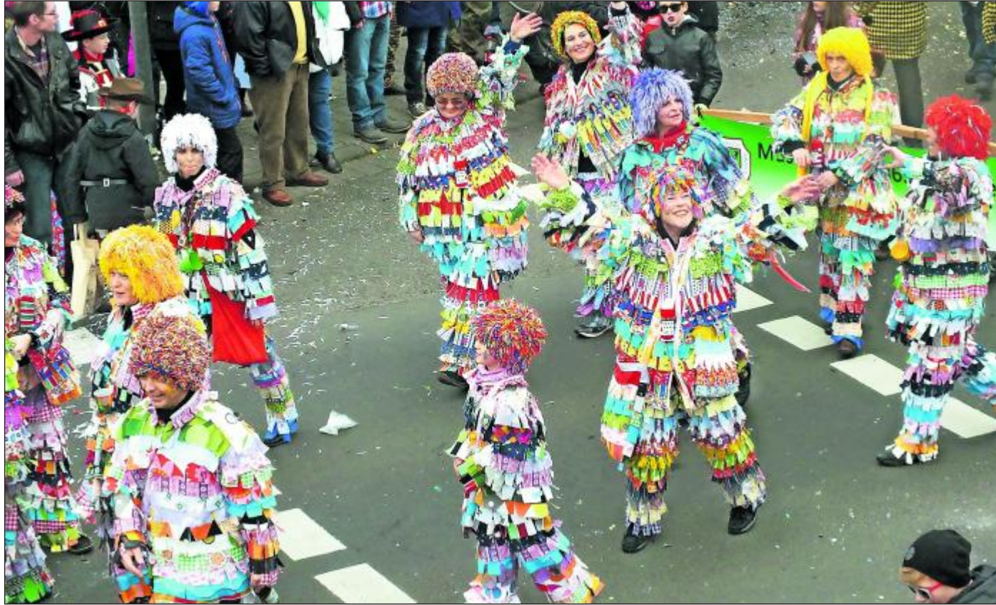
Einer der Favoriten der Jury: Der Damen-Gymnastikverein Hesseldorf sorgt mit seinen bunten Flickenkostümen auch optisch für gute Laune.

... erlebten die Volleyballer des TV Salmünster einen schwarzen Tag: Die TVS-Landesligateams der Männer und Frauen stiegen auch rechnerisch ab.