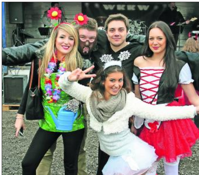
Blümchen für den Frühling - dieses Mal auf dem Kopf.