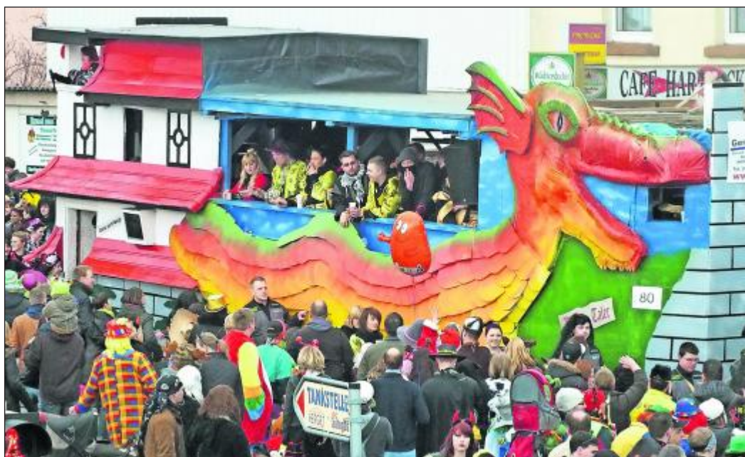
Die Bracht-Taler mit ihrem asiatischen Drachen-Wagen.